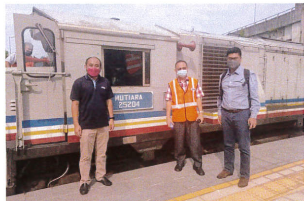
Koc Khas membawa pembida menjelajahi fasiliti KTMB di dalam Sistem Rel Berkembar Negara